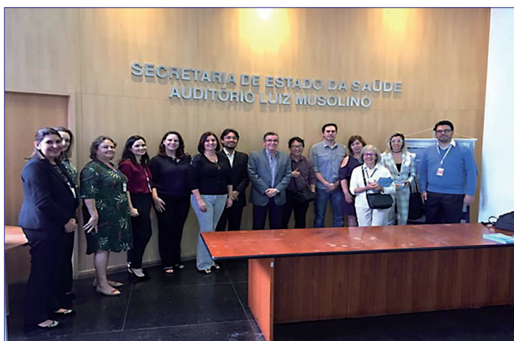
Evento de lançamento da nova interface de acesso e novos produtos da BVS Rede de Informação e Conhecimento