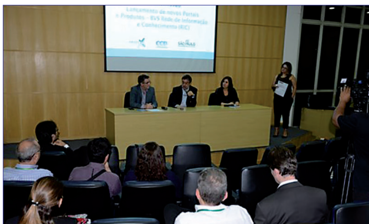
Evento de lançamento da nova interface de acesso e novos produtos da BVS Rede de Informação e Conhecimento

O novo portal da BVS RIC foi lançado oficialmente em 03 de julho de 2019 visando promover, divulgar e compartilhar as melhorias com a comunidade científica da instituição. Estiveram presentes no evento autoridades da SES/SP, da Bireme/OPAS/OMS, bibliotecários das unidades cooperantes, pesquisadores e funcionários. O evento contou com a participação de cerca de 70 pessoas, foi gravado, transmitido online e o vídeo está indexado e está disponível no Portal Multimídia da BVS RIC.