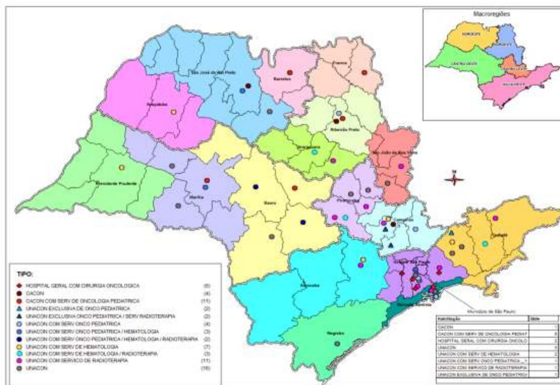
Figura 2. Distribuição dos serviços de Oncologia nas regiões de saúde. Estado de São Paulo, 2011.