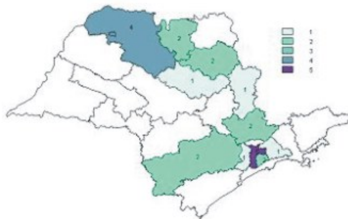
Figura 1 – Distribuição das unidades sentinelas de coqueluche, segundo Direção Regional de Saúde, Estado de São Paulo, 2005

A vigilância estruturada no modelo de unidades sentinelas tem permitido um melhor acompanhamento da tendência da coqueluche, possibilitando a exclusão mais segura das demais síndromes pertussis. O Instituto Adolfo Lutz (IAL) é o laboratório de referência para a doença no Estado de São Paulo e em todo o território nacional (1) .