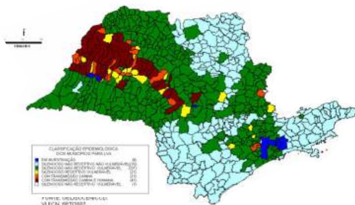
Figura 2. Distribuição dos municípios do Estado de São Paulo segundo a classificação epidemiológica para leishmaniose visceral americana – Setembro/2007.

Comparada à situação de março/2007 (Figura 1) verificou-se a expansão do vetor para novos municípios das regiões de Marília e Presidente Prudente e a notificação de casos humanos. No entanto, esses casos foram registrados em cidades que já haviam registrado casos em 2006.