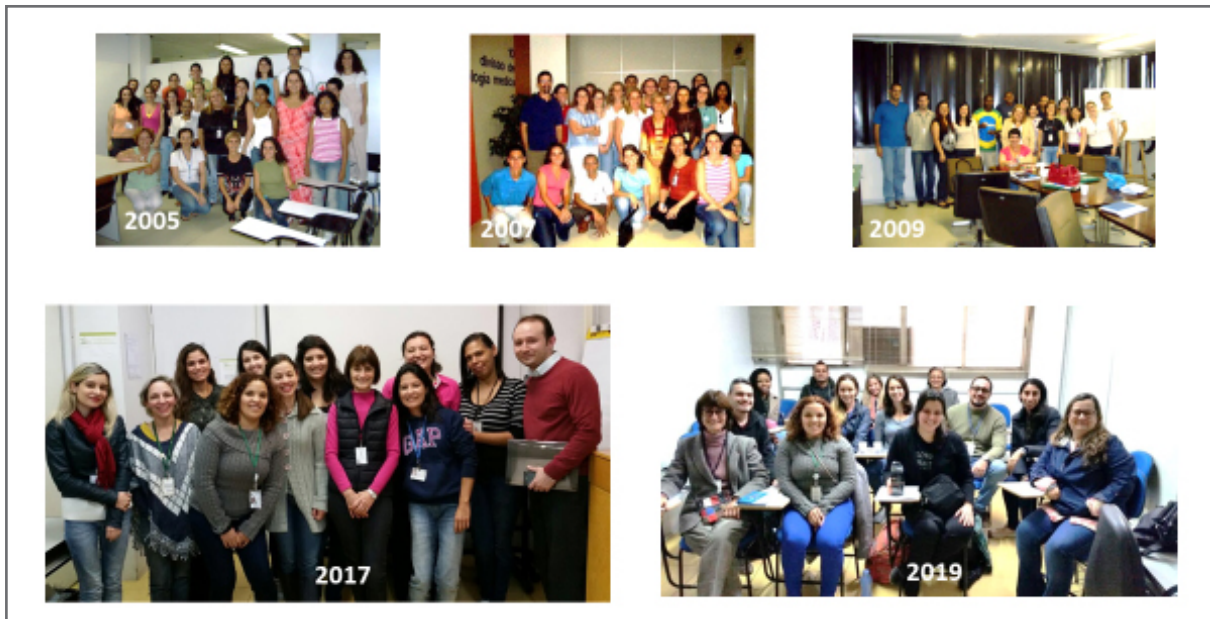
Figura 4. Alunos de mestrado e doutorado do Programa de Pós-Graduação em Ciências da CCD/SES-SP da disciplina de HTLV.

Nos últimos anos, a autora tem colaborado na divulgação do Dia Mundial do HTLV com artigos publicados no BEPA e RIAL, 75,76 palestras ministradas no IAL e uma veiculada no canal Youtube Saúde em Rede da CCD/SES-SP, 77 expondo banners no saguão dos prédios da SES-SP e do IAL (Figura 5). O conjunto dessas ações foi apresentado durante o Webinar HTLV World Day: Health Policies to Eliminate HTLV, patrocinado pela PAHO em 2021, e foi premiado no evento. 78