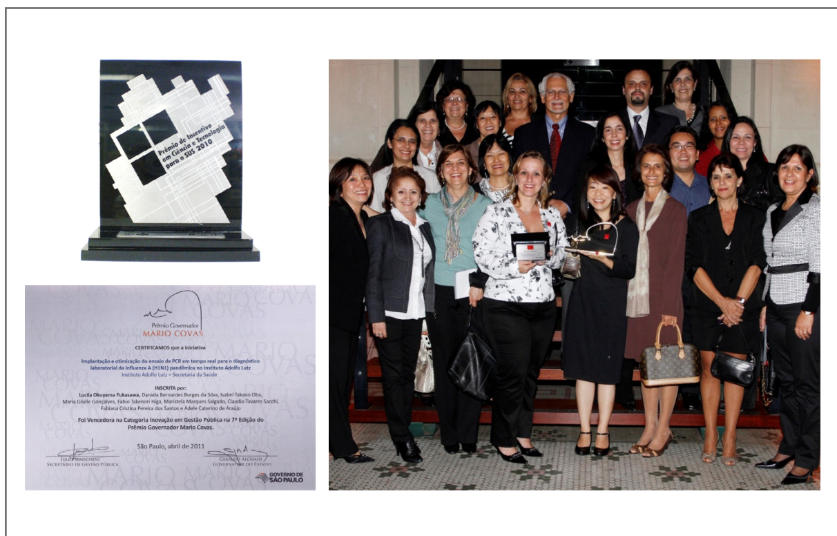
Figura 3. Prêmio de Incentivo em Ciência e Tecnologia para o SUS 2010, Certificado Prêmio Governador Mário Covas, Equipe do IAL presente na Cerimônia de Premiação na Sala São Paulo em 2011.