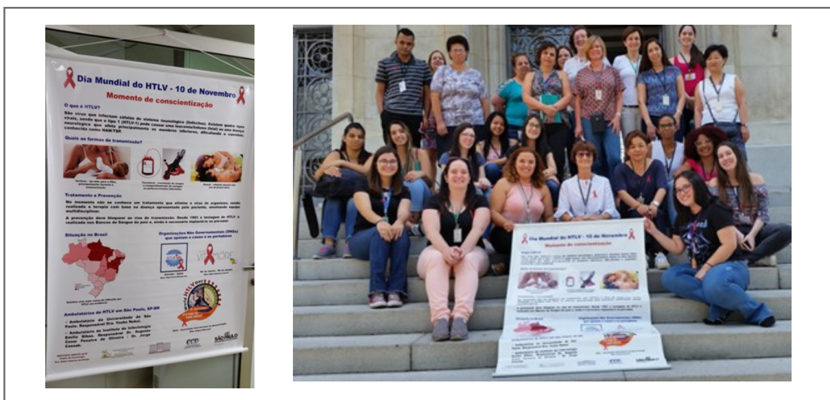
Figura 5. Banner e equipe do CIM-IAL na divulgação do Dia Mundial de HTLV – 10 de Novembro.

Nos últimos anos, a autora tem colaborado na divulgação do Dia Mundial do HTLV com artigos publicados no BEPA e RIAL, 75,76 palestras ministradas no IAL e uma veiculada no canal Youtube Saúde em Rede da CCD/SES-SP, 77 expondo banners no saguão dos prédios da SES-SP e do IAL (Figura 5). O conjunto dessas ações foi apresentado durante o Webinar HTLV World Day: Health Policies to Eliminate HTLV, patrocinado pela PAHO em 2021, e foi premiado no evento. 78