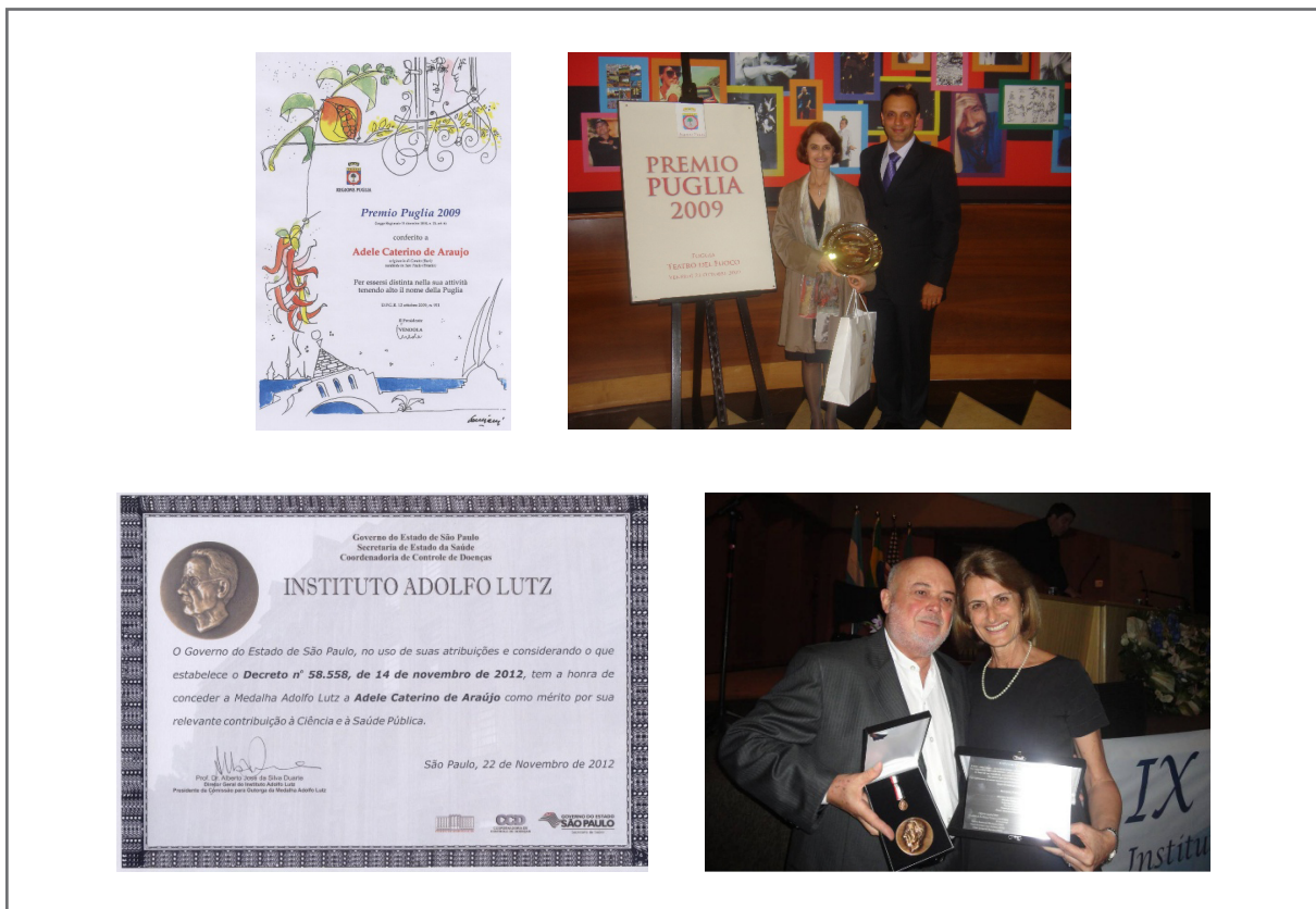
Figura 6. Prêmio Puglia 2009 e Medalha Adolfo Lutz.

Como reconhecimento à sua dedicação, recebeu na Itália o Prêmio Puglia 2009, conferido a pessoas de origem italiana que se destacaram em sua atividade mantendo elevado o nome da Puglia, e, em 2012, a Medalha Adolfo Lutz, conferida pelo Governo do Estado de São Paulo por sua relevante contribuição à Ciência e à Saúde Pública (Figura 6).