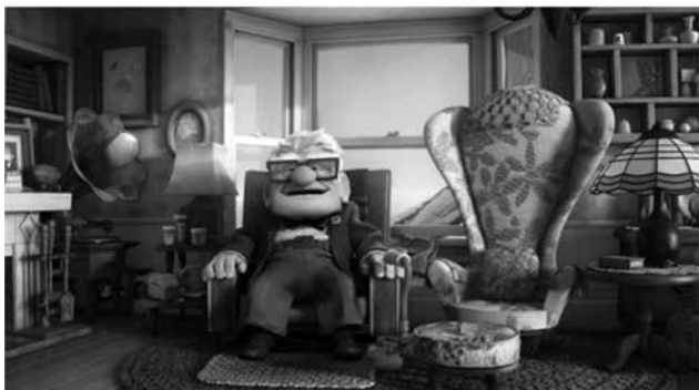
Cena da animação “Up - Altas Aventuras” 3 , em que o personagem Carl Fredricksen, de 78 anos, está sobrevoando o espaço dentro de sua casa içada ao ar por balões.

Prudência e vigilância marcam o acelerado fenômeno do envelhecimento populacional, evidenciando uma preocupação internacional no âmbito da saúde, política e economia. O envelhecimento passa a justificar a redefinição de políticas e programas que visam transformar o perfil mundial da velhice. Surgem novas modalidades políticas de gestão da população idosa.