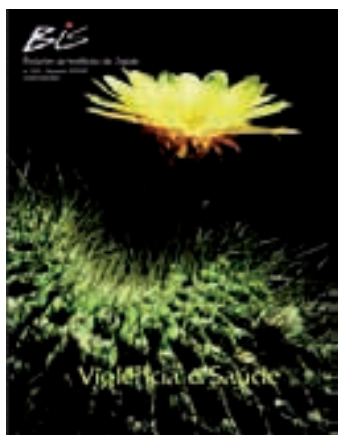
Nº 33 - 08/2004 Violência e Saúde