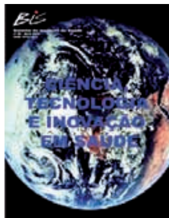
Nº 29 - 04/2003 C & T e Inovação