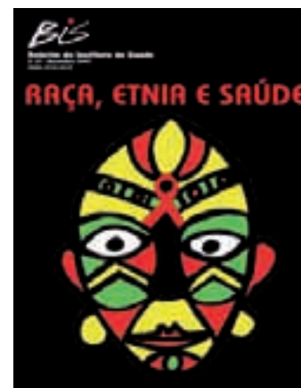
Nº 31 - 12/2003 Raça, Etnia e Saúde