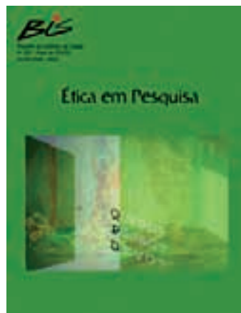
Nº 35 - 04/2005 Ética em Pesquisa