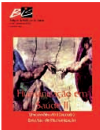
Nº 36 - 08/2005 Humanização em Saúde II