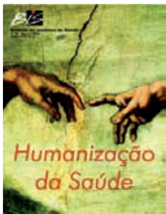
Nº 30 - 08/2003 Humanização da Saúde