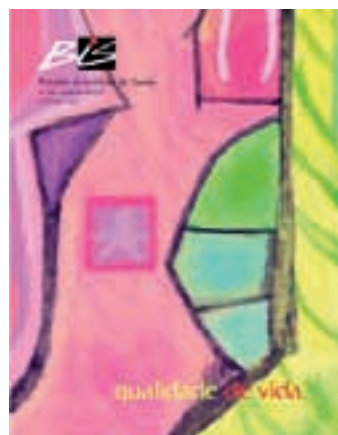
Nº 32 - 04/2004 Qualidade de Vida