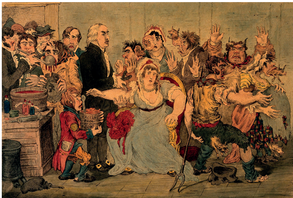
Figura 4. Sátira contra a vacinação antivariólica de Edward Jenner. Gravura de J. Gillray (1802).

Uma controvérsia bastante conflituosa, usada em disputas políticas, mas que é também fundamentalmente científica diz respeito ao aquecimento global, pelas suas implicações no meio ambiente, como será abordado a seguir.