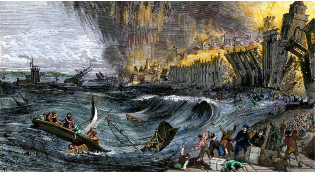
Figura 1. O terremoto de Lisboa (1755) – Ilustração do século XIX.

Em 1º de novembro de 1755 um grande terremoto sacudiu a cidade de Lisboa, seguido de maremoto e incêndio. O abalo desencadeou um tsunami com ondas de até 30 m de altura. Como resultado da catástrofe, estima-se que houve de 10 mil a 30 mil mortos e a destruição de boa parte das edificações, principalmente na parte medieval da cidade e nas regiões que margeiam o Rio Tejo, deixando cerca de 100 mil pessoas desabrigadas (Figura 1). Algumas estimativas indicam que o terremoto atingiu o grau 9 na escala Richter. O maremoto chegou a ser sentido na costa do Brasil, do outro lado do Atlântico e em outro hemisfério.