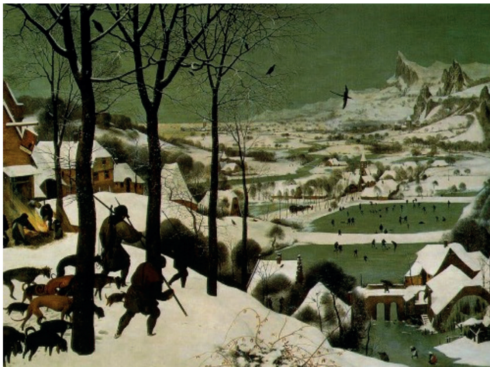
Figura 5. Caçadores na neve (1565), de Pieter Bruegel, o Velho - paisagem comum durante a Pequena Idade do Gelo - Fonte: Wikipedia

É bem sabida a dificuldade da ciência da meteorologia em fazer previsões exatas. Isso não se deve a nenhuma deficiência intrínseca dessa ciência, mas sim à interveniência de muitas variáveis cuja velocidade de ação é complexa e não linear, não conseguindo ser adequadamente prevista nos modelos matemáticos que usamos. A climatologia também sofre esse tipo de percalço, apesar de avanços constantes nas observações e técnicas utilizadas. Se já é difícil fazer previsões meteorológicas de curto prazo, a dificuldade aumenta mais ainda para previsões climatológicas de médio e longo alcance.