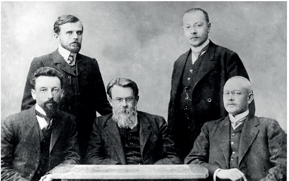
Figura 3. Vladimir Vernadsky (centro) e seus alunos-assistentes na Universidade de Moscou em 1911.

A biosfera transformou a geosfera graças à ação do ser vivo, que modifica o não-vivo. Com a evolução da vida, foi possível surgir a espécie humana, cuja maior capacidade cognitiva possibilitou que na biosfera terrestre fosse paulatinamente dominante a razão, pelo uso da ciência. A "noosfera" passou a designar o alcance cada vez maior da humanidade, capaz de conhecer, pela ciência, a história de sua evolução e cujo potencial de ação não conhece limites. O pensamento científico atingido pela mente humana age como uma verdadeira força geológica, manifesta pela intervenção no meio físico graças à aplicação da ciência na tecnologia e industrialização. Nessa perspectiva, tal ação humana na geologia pode ser benéfica para o restante da natureza, inclusive para outros seres vivos.