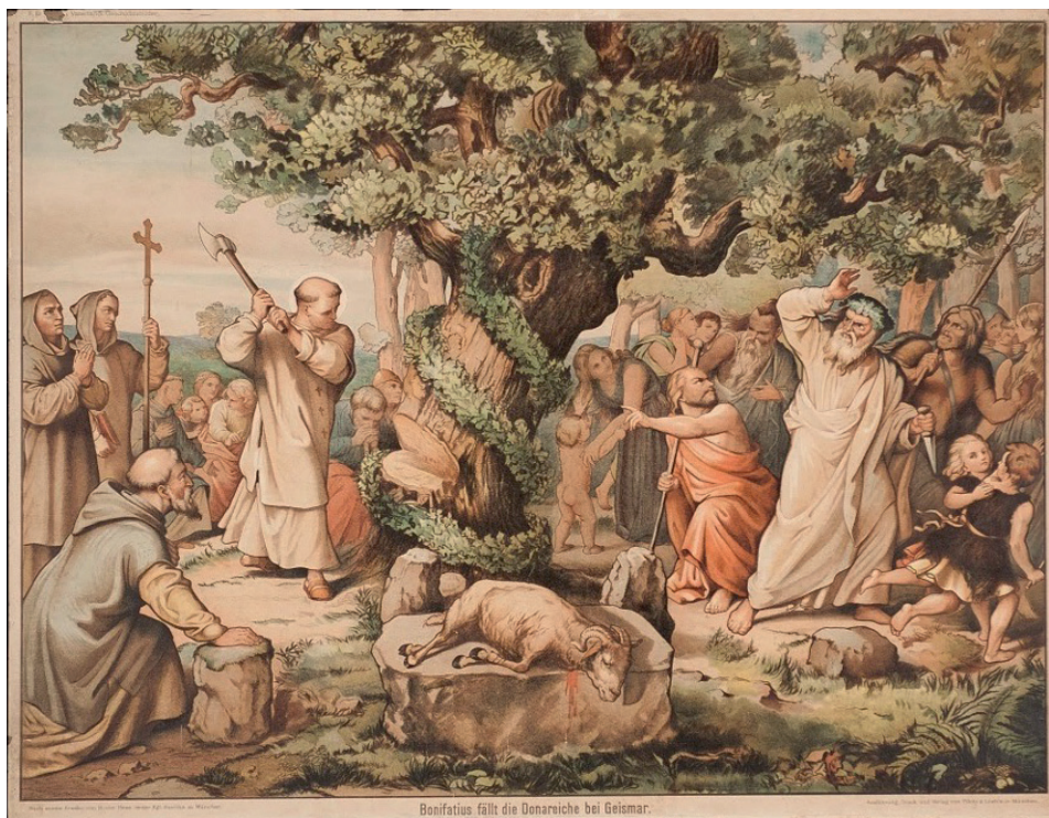
Figura 5. Caçadores na neve (1565), de Pieter Bruegel, o Velho - paisagem comum durante a Pequena Idade do Gelo

seja, não considerar que historicamente o homem sempre lutou para dominar a natureza. A partir da Conferência de Estocolmo (1972), assinala-se que mudou a aspiração ao domínio científico do meio ambiente, considerando a natureza como um meio, e não como um fim em si mesma, substituída pela ideologia ecologista inversa, de que a natureza é o fim e a sociedade um meio para garantir a sobrevivência do planeta. 19 A clivagem envolvia também movimentos políticos divergentes, pois, mesmo distante de ideias socialistas, países pobres e atrasados em relação às economias ricas viam com desconfiança a tentativa por meio do ambientalismo de refrear seus anseios de industrialização, acusados de causar poluição ambiental, como se muitas dessas economias avançadas não tivessem feito o mesmo. Esses temas voltaram a aparecer nas demais conferências ambientais, como a do Rio de Janeiro (1992), a de Kyoto (1997) e a de Paris (2021), em que ocorreu a capitulação à supremacia da "mãe natureza" e firmou-se o entrelaçamento entre metas ambientais e climáticas, adotando as conclusões dos cientistas filiados à teoria do aquecimento global.